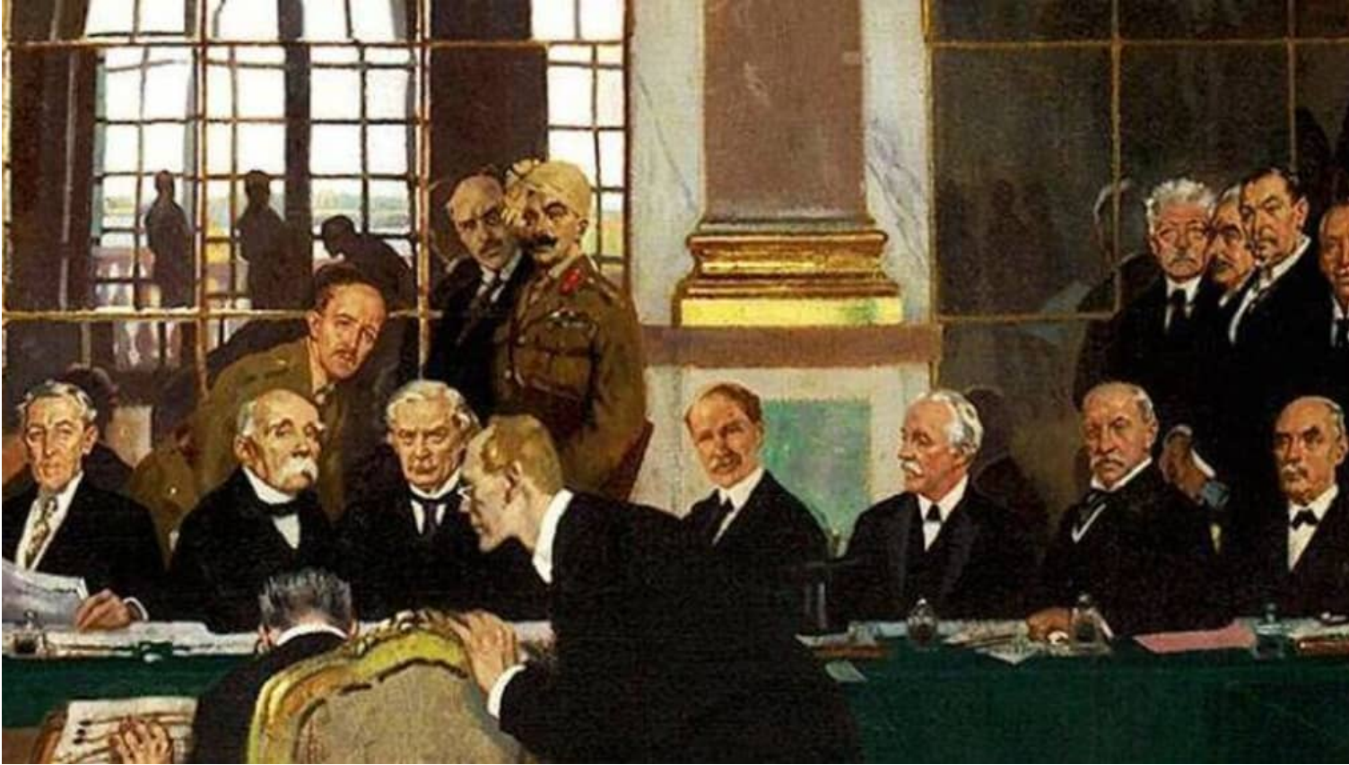
La signature du traité de Versailles.

Le Monument aux morts d'Arcachon, réalisé par le sculpteur Alexandre Maspoli en 1924 est considéré comme pacifiste et il est constitué d'une Victoire soutenue par des soldats sans visages. Des inscriptions d'inspirations pacifistes ceinturent le monument. Les pleureuses symbolisent la douleur après la perte d'un père, d'un mari ou d'un enfant lors de la Guerre mondiale. Cette guerre a mis en jeu plus de soldats, provoqué plus de décès et causé plus de destruction matérielle que toute guerre antérieure. .