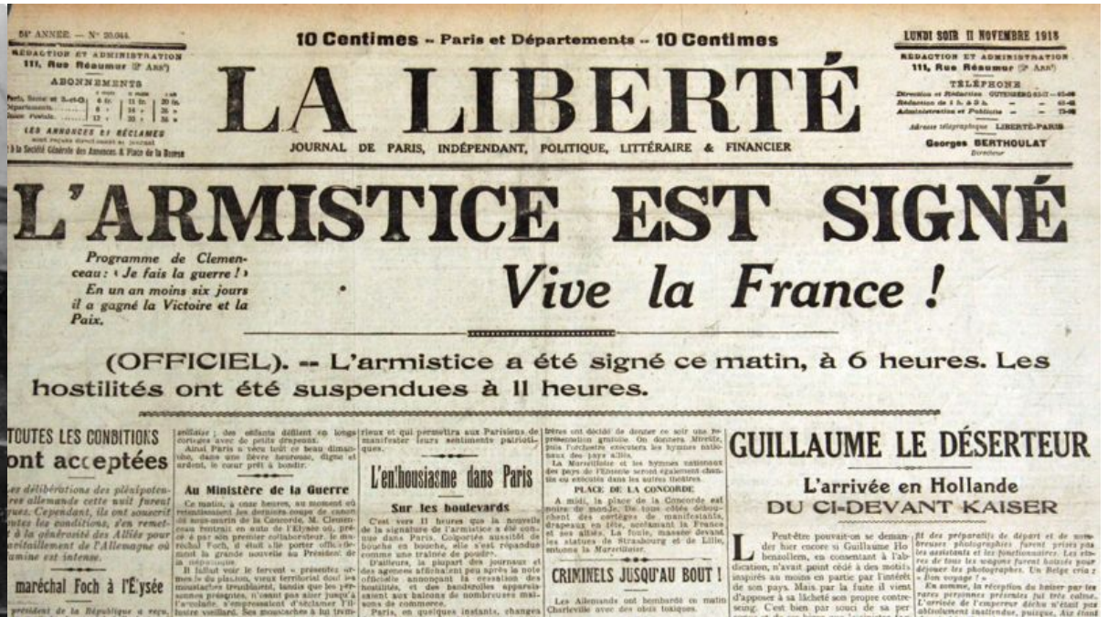
Parmi d'autres "La Une du journal "La Liberté"