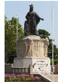
Le monument aux morts d'Arcachon

L'armistice de 1918 mettant fin aux hostilités, il fallait encore mettre fin à la guerre. La signature du Traité de Versailles a lieu le 28 juin 1919... à Versailles. Il condamne lourdement l'Allemagne. "Diktat" sera le terme employé pour désigner ce Traité imposé aux Allemands sans négociations par les vainqueurs de la Première guerre mondiale. Il mettra fin à la Première Guerre mondiale et il est signé dans la galerie des Glaces du château de Versailles, entre l'Allemagne et les Alliés. Il a été préparé par les vainqueurs, le Français Clemenceau, le Britannique Lloyd George, l'Italien Orlando et l'Américain Wilson. Il impose notamment à l'Allemagne la restitution de l'Alsace-Lorraine, la création du "couloir de Dantzig" donnant à la Pologne un accès à la mer, la limitation du potentiel militaire et le versement de 20 milliards de marks-or. En Allemagne, ce "diktat" sera donc vécu comme une humiliation et fera naître un sentiment de revanche.