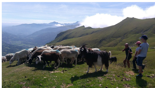
Avec le troupeau